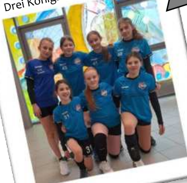
Drei Königsturnier Bretten