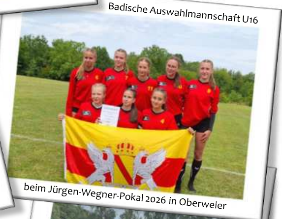
Badische Auswahlmannschaft U16