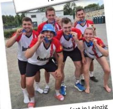
Wowball beim Turnfest in Leipzig