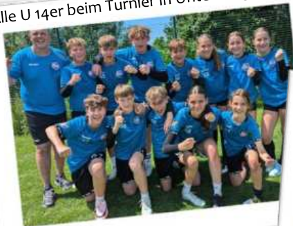
Alle U 14er beim Turnier in Unterhaugstett

(SG mit FBC Offenburg) holte sich die Silbermedaille bei der Badischen Hallenmeisterschaft.