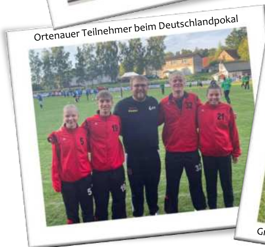
Ortenauer Teilnehmer beim Deutschlandpokal