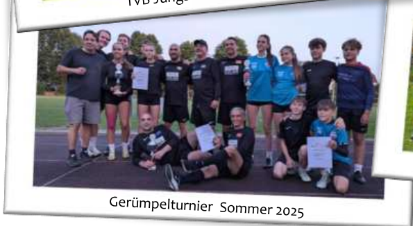
Gerümpelturnier Sommer 2025