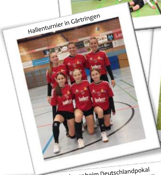
Hallenturnier in Gärtringen