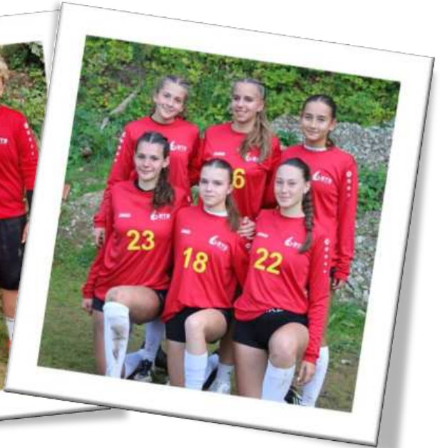
Spieler des TV 1846 Brettens beim Jugendeuropapokal 2025 in Dresden