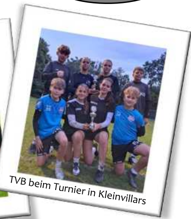
TVB beim Turnier in Kleinvillars