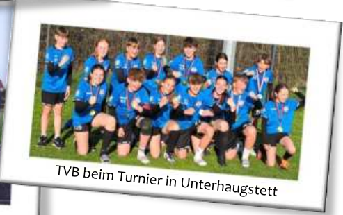
TVB beim Turnier in Unterhaugstett