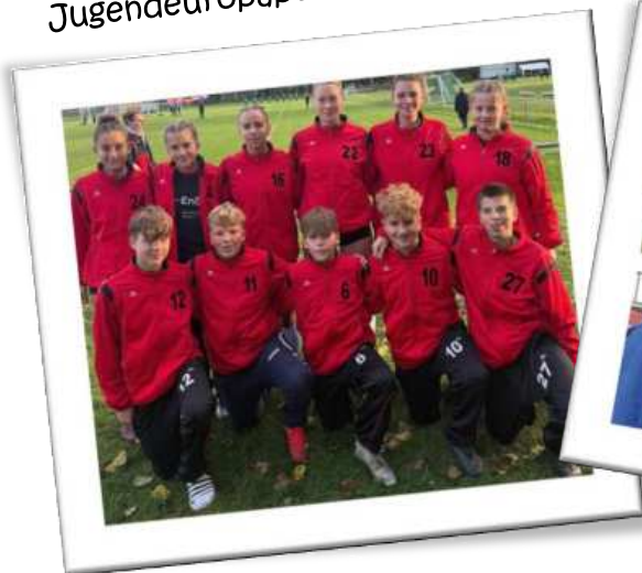
Spieler des TV 1846 Brettens beim Bundeslehrgang