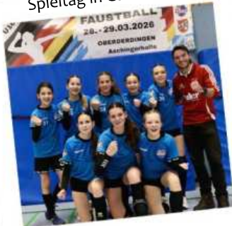
Spieltag in Gärtringen