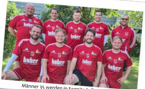
Männer 35 werden in Segnitz 6. Deutscher Meister