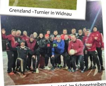
Neujahrsturnier 2026 im Schneetreiben