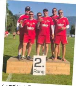
Grenzland-Turnier in Widnau