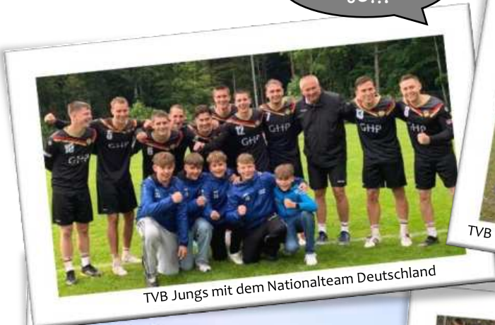
TVB Jungs mit dem Nationalteam Deutschland